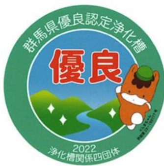
優良浄化槽認定シール